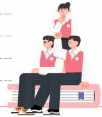
2025학년도 수시모집 논술 최종합격자 수능 과목별 등급 분포 (자연)